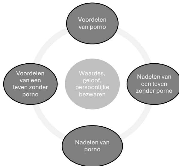
Figuur 4: Zowel aan het kijken van porno als aan een leven zonder porno zitten zowel nadelen als voordelen. Voor een groot deel gaat dat om je directe ervaringen, maar op een dieper niveau gaat het ook over hoe je denkt en voelt, oftewel hoe dit samenvalt met je waarden. Om duurzaam te kunnen stoppen met porno is het essentieel dat je al deze afwegingen bewust hebt gemaakt.

in je schoenen te staan en de juiste afwegingen te maken, is het essentieel om je bewust te worden van zowel de voordelen en de nadelen van je pornogebruik. Daarbij is het belangrijk om dit van zoveel mogelijk kanten te belichten. Een bepaald nadeel van veel pornokijken (bijvoorbeeld een verlaagd libido) staat tegenover het voordeel dat je ervaart als je stopt met porno (in dit geval een hoger libido). En een bepaald voordeel dat je ervaart door porno te kijken (bijvoorbeeld stoom afblazen als je gestrest bent) staat tegenover het nadeel van het stoppen met porno (meer stress). Dit zijn belangrijke afwegingen die je heel bewust moet maken om de stap om te stoppen met porno met toewijding te kunnen zetten en je motivatie op de lange termijn te kunnen behouden. In het midden van dat alles staat hoe jij deze voor- en nadelen persoonlijk ervaart, maar ook hoe je op een dieper niveau denkt en voelt over porno en jouw consumptie daarvan (Figuur 4). In de volgende paragrafen gaan je voor jezelf overzicht aanbrengen in deze materie.